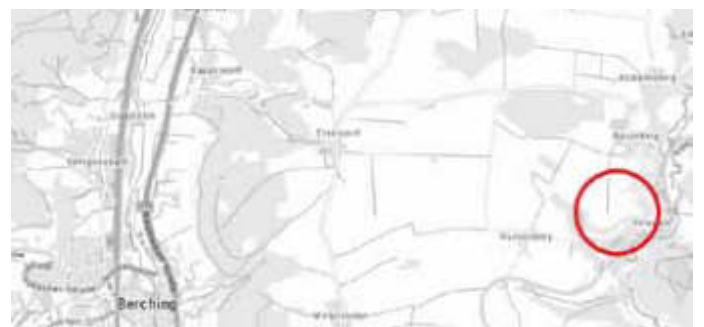
Abb. Übersicht Lage des Vorhabens

Für die Änderung des Flächennutzungsplanes mit integriertem Landschaftsplan ist vom Landratsamt Neumarkt i. d. OPf. mit Schreiben vom 26.07.2024, Az. 43-610-01-FNP-003 gemäß § 6 Abs. 4 Satz 4 BauGB für das nachstehend dargestellte Gebiet eine Fiktionsbescheinigung erstellt worden. Die Genehmigung der Änderung des Flächennutzungsplanes gilt auf Grund des Fristablaufs als erteilt.