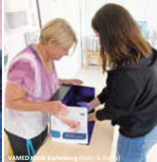
VAMED Klinik Kipfenberg