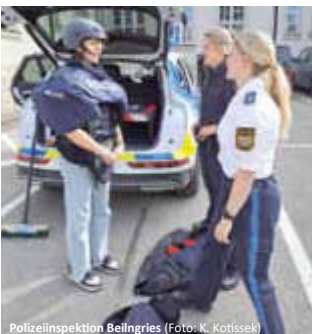
Polizeinspektion Beilngries