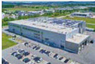
GEWERBE- &amp; INDUSTRIEBAU