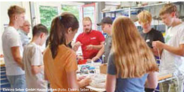
Elektro Seber GmbH Haunstetten (Foto: Elektro Seber GmbH)