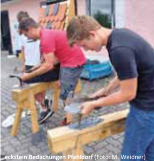
Elekstein Bedachungen Pfahlndorf