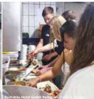
Fuchsbau Hotel GmbH Beilngries