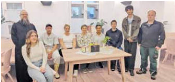
Neue Auszubildende und Ausbilder im Kloster Plankstetten (leider nicht vollzählig)

Die Auszubildenden haben in Plankstetten in der Metzgerei, Landwirtschaft, Küche, Gärtnerei und in der Verwaltung ihren Platz eingenommen. Das gesamte Team freut sich und wünscht allen einen super Start, viel Lernmotivation und Gottes Segen.