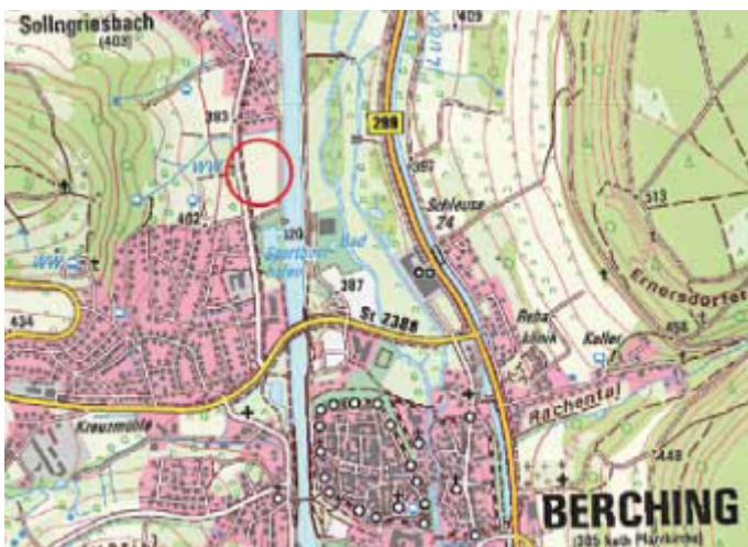
Abb. Übersicht Lage des Vorhabens

Für die Änderung des Flächennutzungsplanes mit integriertem Landschaftsplan ist vom Landratsamt Neumarkt i. d. OPf. mit Schreiben vom 26.07.2024, Az. 43-610-01-FNP-007 gemäß § 6 Abs. 4 Satz 4 BauGB für das nachstehend dargestellte Gebiet eine Fiktionsbescheinigung erstellt worden. Die Genehmigung der Änderung des Flächennutzungsplanes gilt auf Grund des Fristablaufs als erteilt.