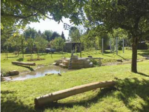
Bei der Anlage des Wasserspielplatzes in Enkering wurde viel Wert auf eine naturnahe Gestaltung gelegt.

Als neuer Spielort wurde im Kindinger Ortsteil Enkering Mitte September ein außergewöhnlicher Wasserspielplatz eingeweiht. Bei sommerlichen Temperaturen konnten die zahlreichen jungen Besucher die Anlage schon ausgiebig testen. Das Projekt zeichnet sich durch eine außerordentlich hohe Bürgerbeteiligung aus. Die Kosten von ca. 200.000 Euro werden mit einer Leader-Förderung von ca. 91.000 Euro bezuschusst.