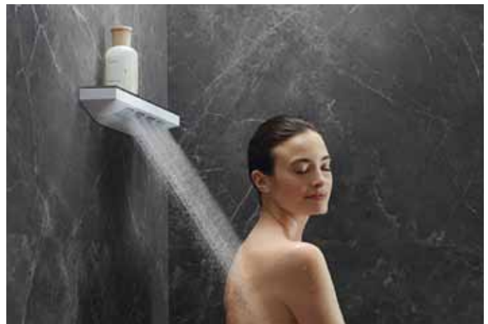
Ob sanfte XL Regendusche oder kräftige Schulterbrause – wir realisieren Ihren Wunsch!