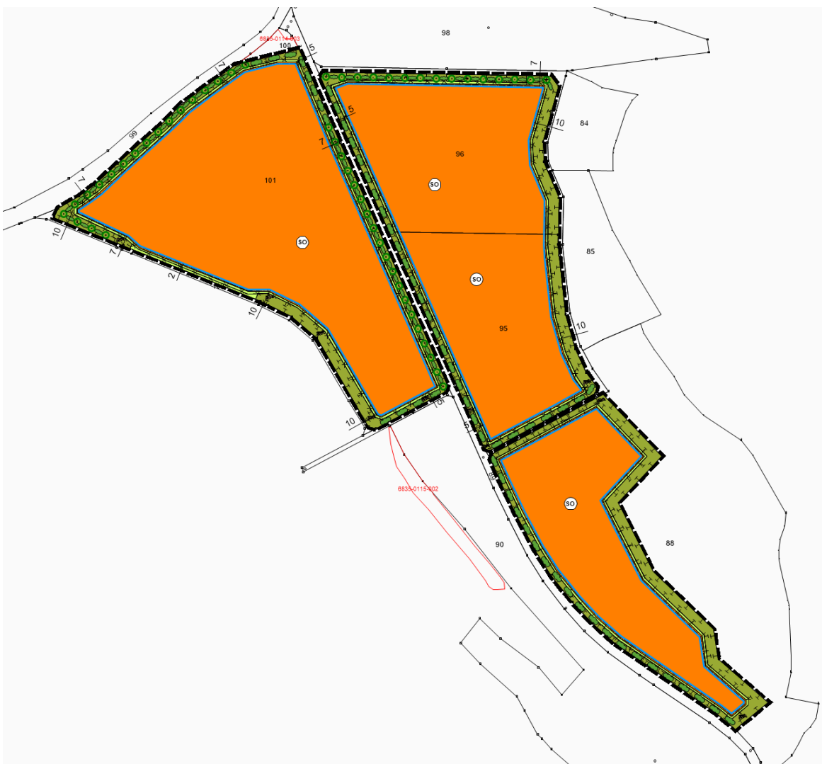
Abb. Geltungsbereich des Vorhabens (Ausschnitt BP ohne Maßstab)