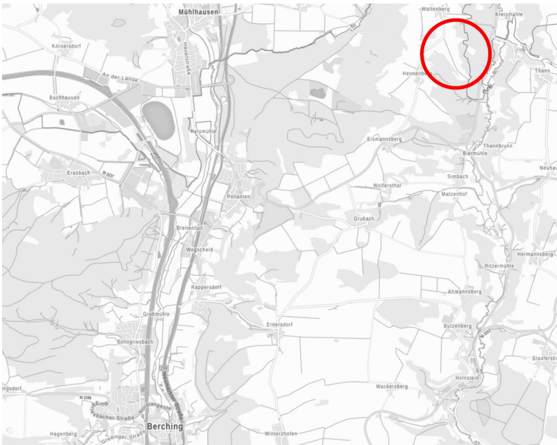
Abbildung Bereich der Änderung des FNP nicht maßstäblich: