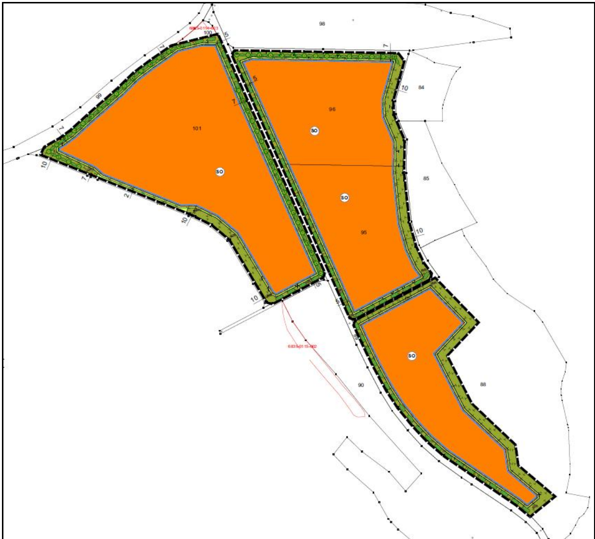
Abbildung 1: Umgrenzung der geplanten PV-Anlage bei Wattenberg