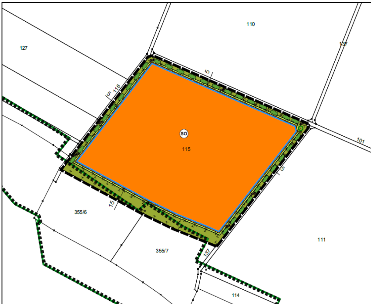
Abbildung 1: Umgrenzung der geplanten PV-Anlage bei Fribertshofen