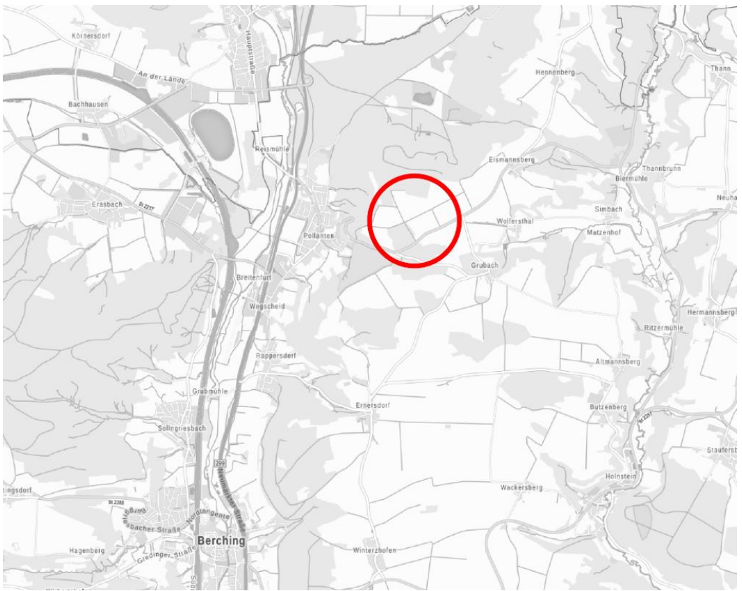
Abb. Lage des Vorhabens (ohne Maßstab)