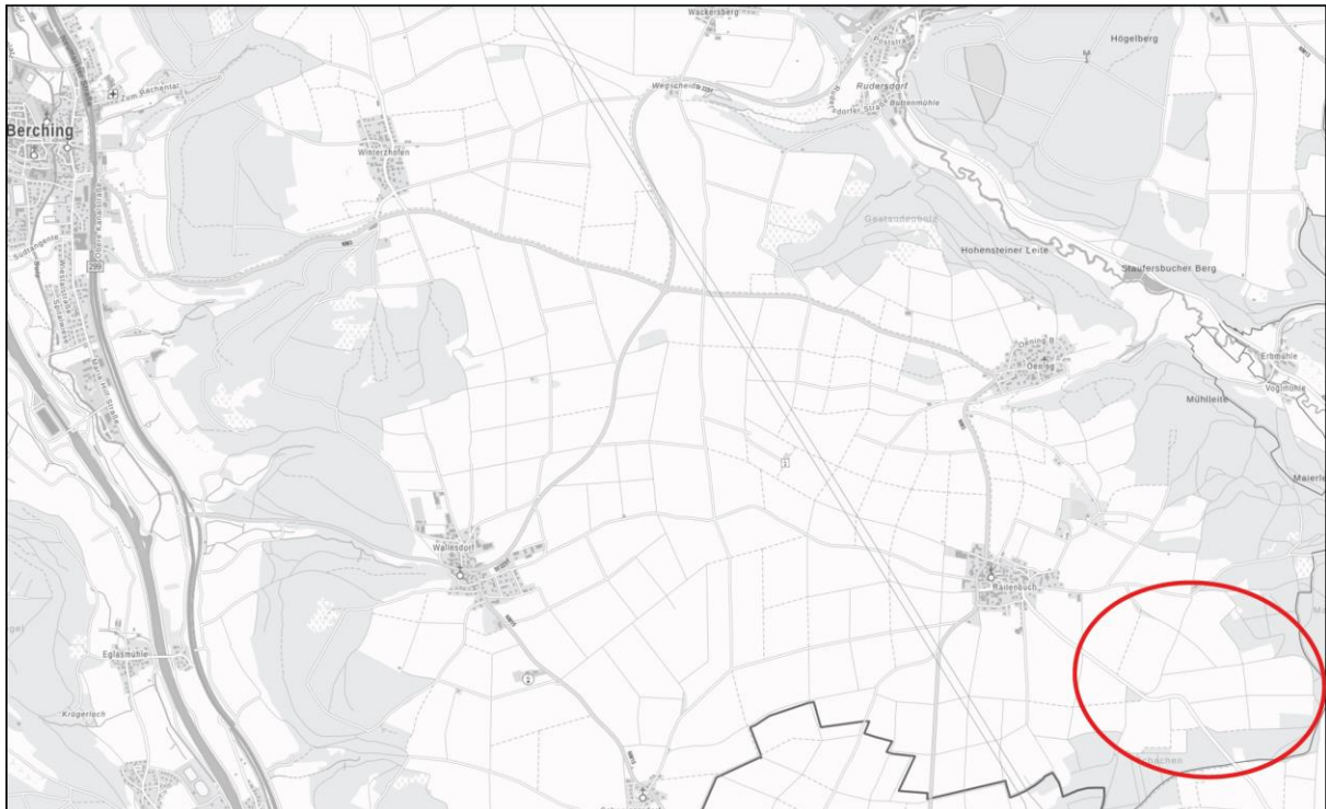
Abb. Übersicht Lage des Vorhabens

Der Geltungsbereich liegt im südöstlichen Stadtgebiet der Stadt Berching (Landkreis Neumarkt i.d. OPf., Regierungsbezirk Oberpfalz).