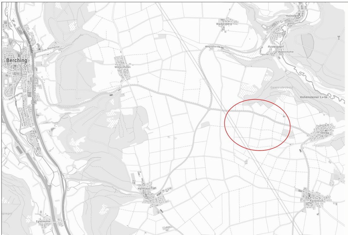
Abb. Übersicht Lage des Vorhabens

Der Geltungsbereich liegt am südöstlichen Stadtgebietsrand von Berching (Landkreis Neumarkt i.d. OPf., Regierungsbezirk Oberpfalz).