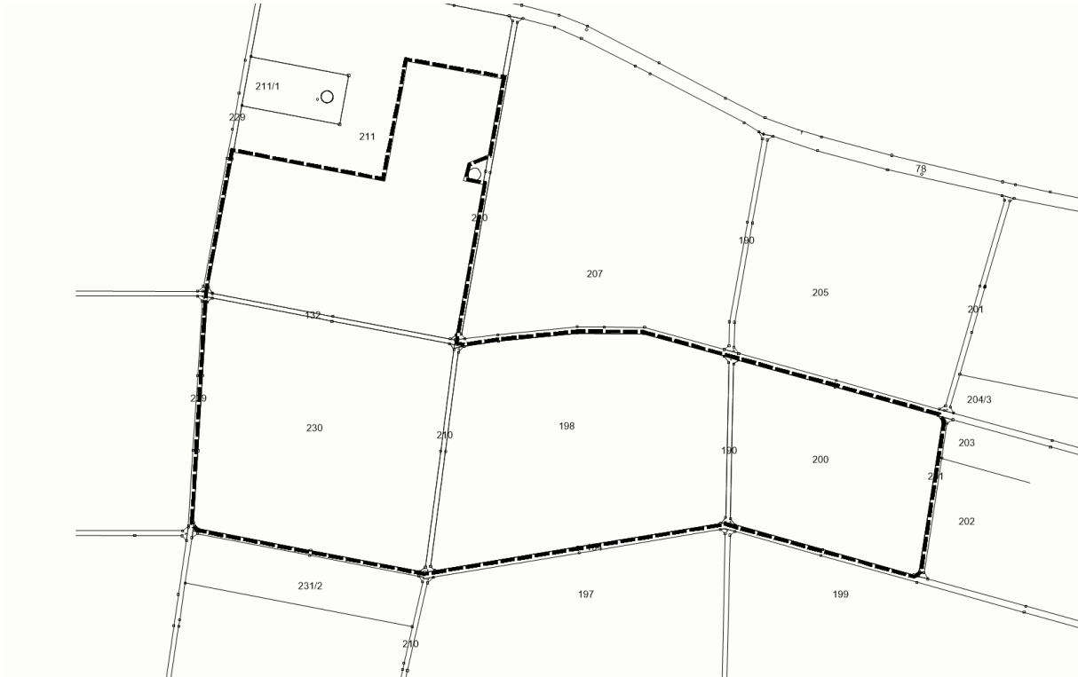
Abb. Geltungsbereich des Vorhabens (ohne Maßstab)

Für das Sondergebiet sind Ausgleichsmaßnahmen erforderlich diese liegen in der Gmkg. Raitenbuch Flurnummer 168 und 299 siehe folgende Abbildungen.