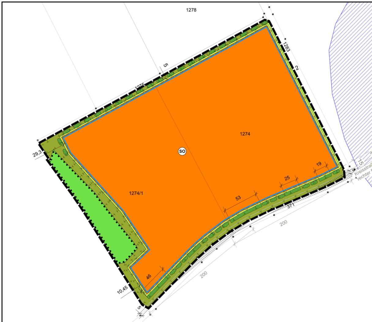
Abbildung 1: Umgrenzung der geplanten PV-Anlage bei Pollanten