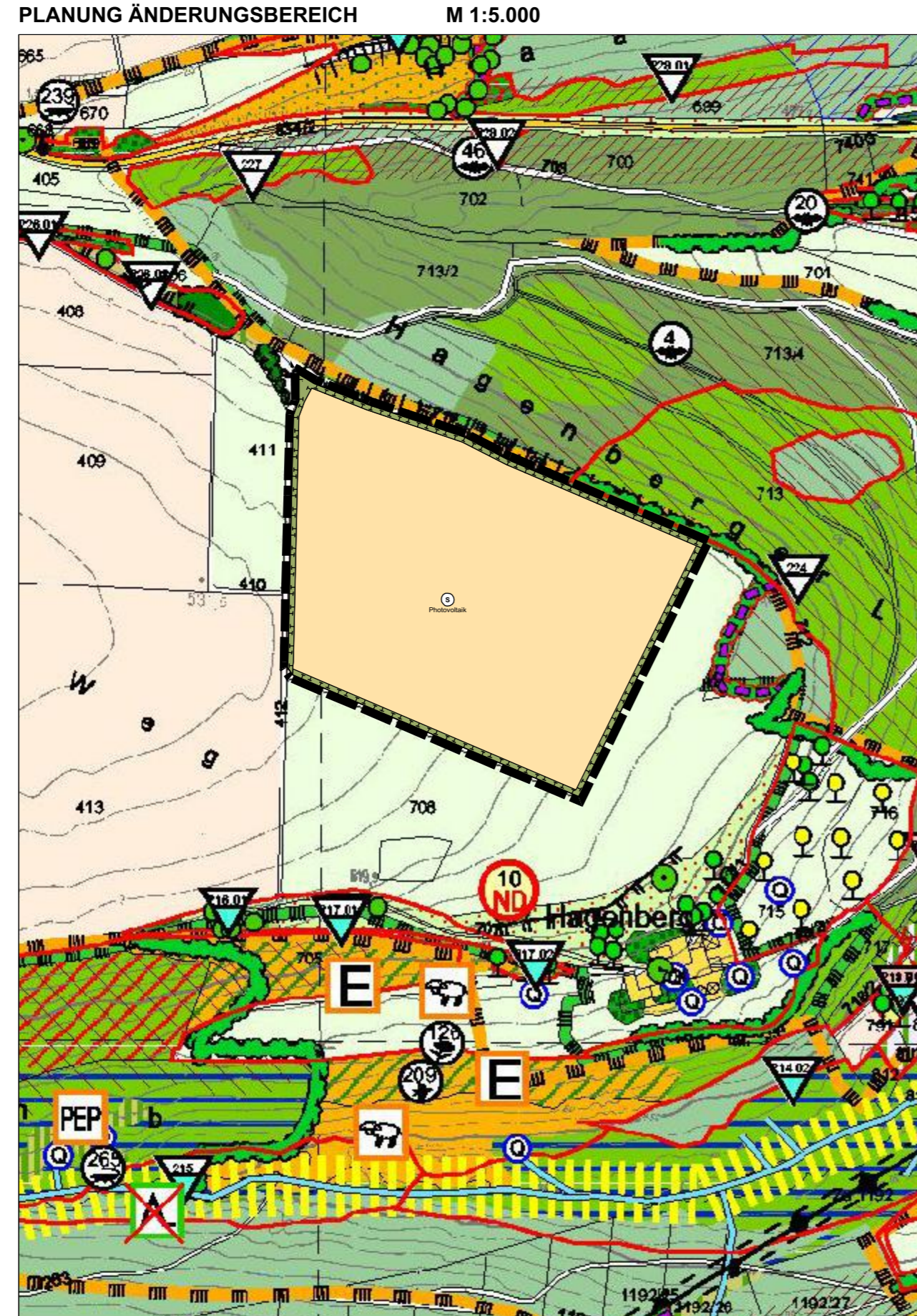
Kartengrundlage: Flächennutzungsplan, digitalisierte Fassung