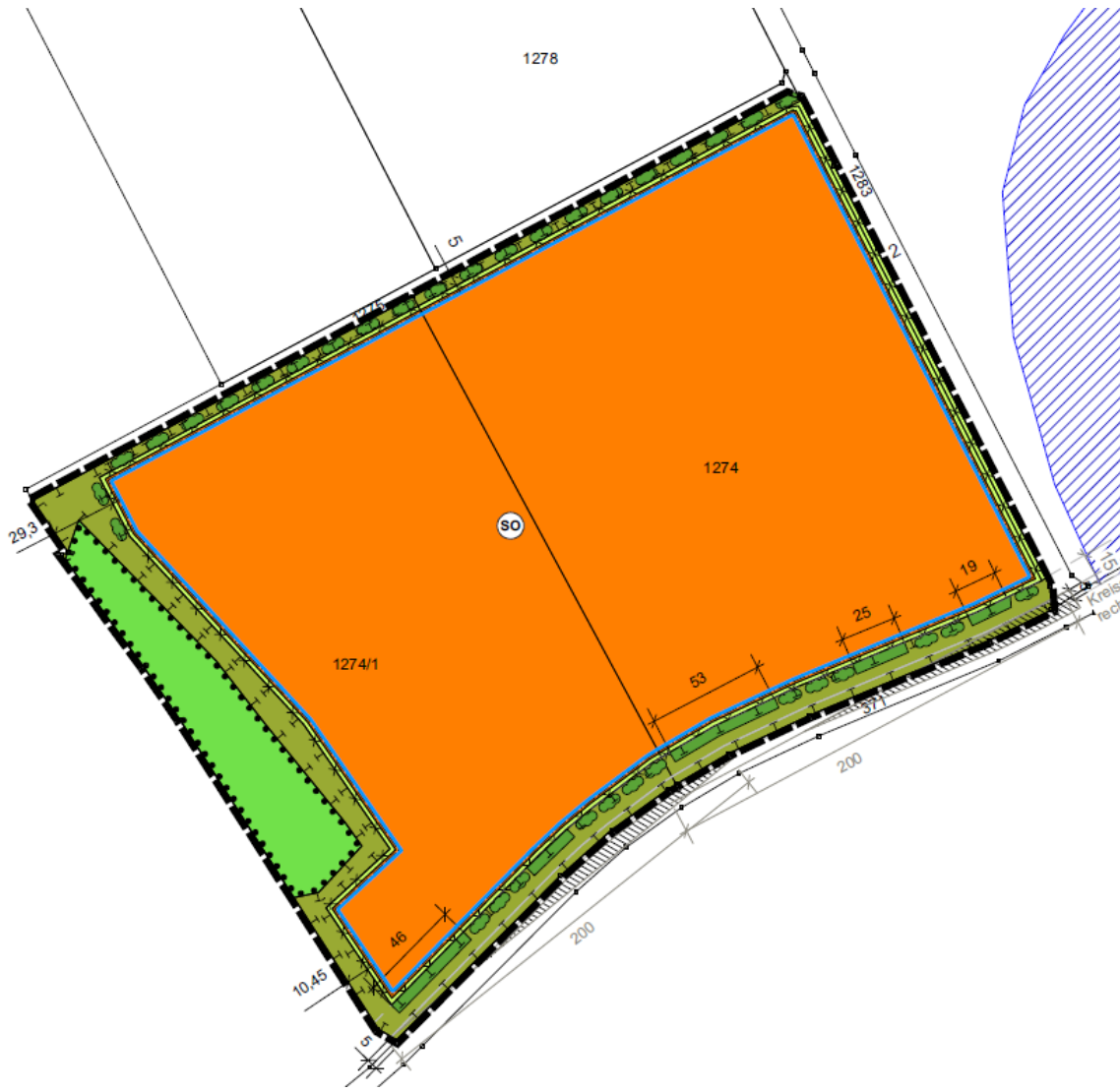
Abb. Geltungsbereich des Vorhabens (Ausschnitt BP ohne Maßstab)

Die Lage und Abgrenzung des Bebauungsplanes ist aus dem nachfolgenden Kartenausschnitt ersichtlich (maßstabslos).