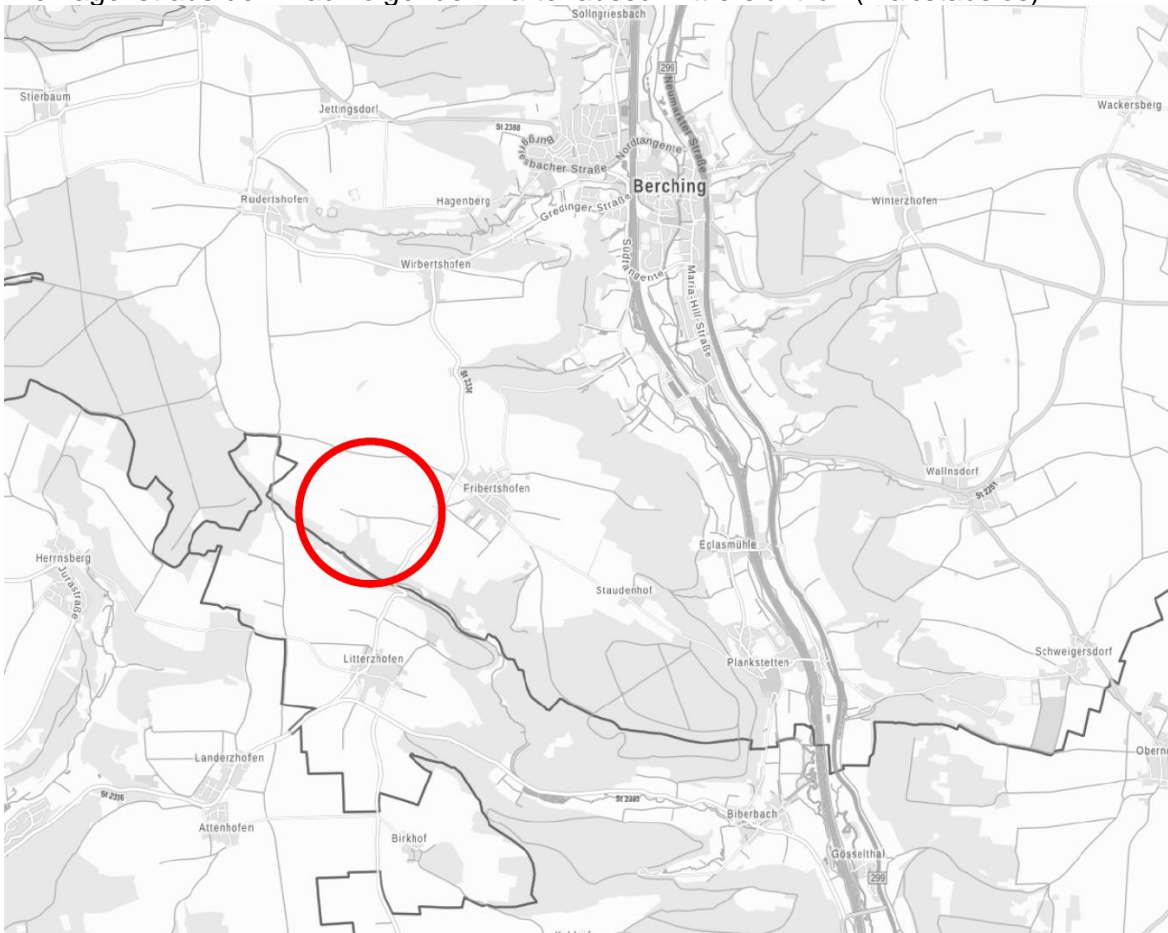
Abb. Lage des Vorhabens (ohne Maßstab)

Die Lage ist aus dem nachfolgenden Kartenausschnitt ersichtlich (maßstabslos).