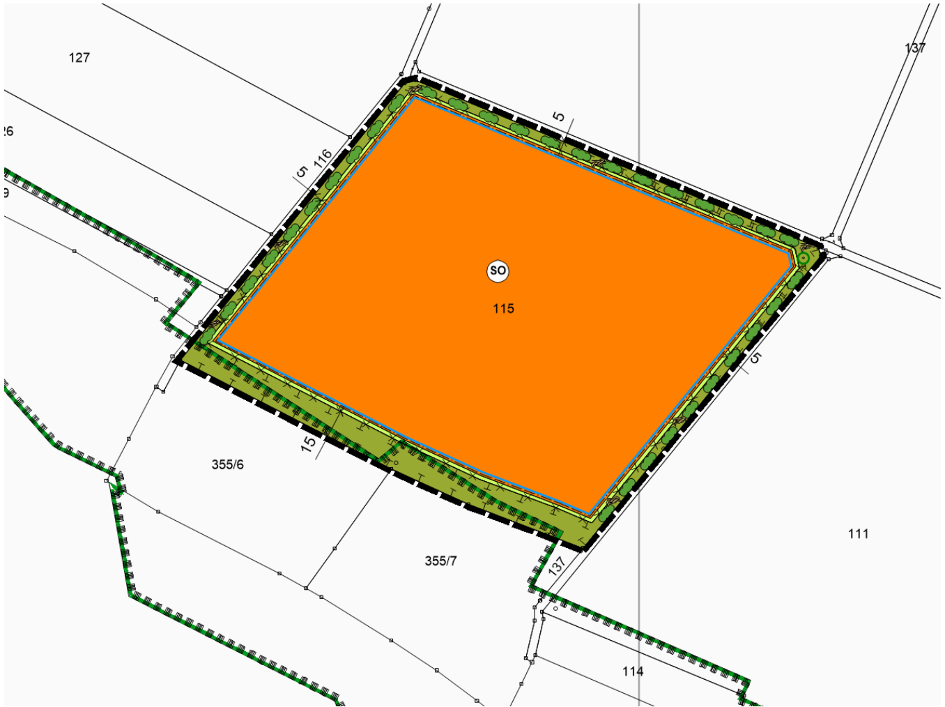
Abb. Geltungsbereich des Vorhabens (Ausschnitt BP ohne Maßstab)

Die Lage und Abgrenzung des Bebauungsplanes ist aus dem nachfolgenden Kartenausschnitt ersichtlich (maßstabslos).